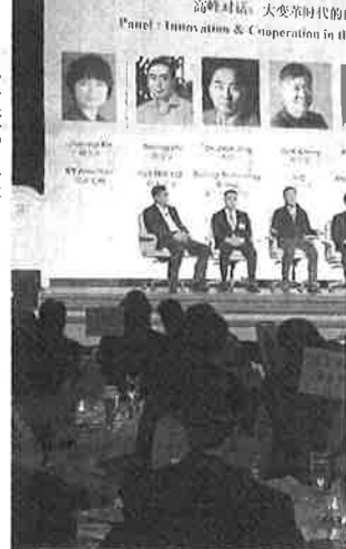
中国総領事館主催のイベントでは当初予定していたファウエイやアリババ集団の幹部は登壇しなかった(米ラスベガス)

きょうのこぼれ あり、中国のハイテク企業を排除する姿勢を強める。電気自動車メーカーの上海蔚来汽車の幹部は「ビジネスは複雑に絡み合っており生態系は壊せない」と話すが、企業の論理を超えた展開が足元では起きている。 (ラッセバガス＝中西豊紀 比奈田悠佑)