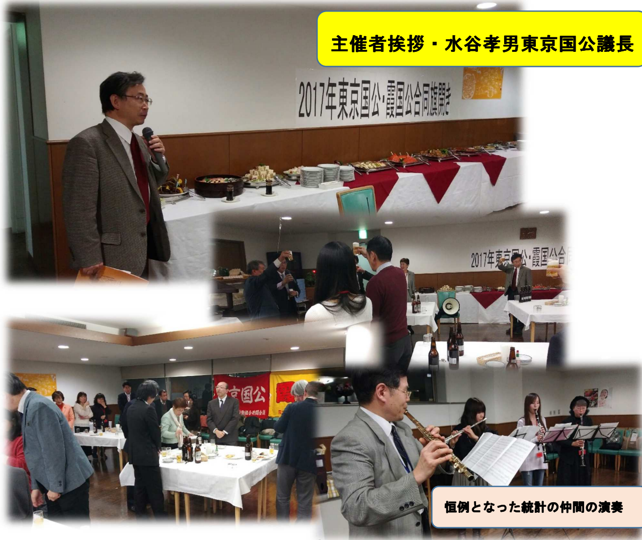
恒例となった統計の仲間の演奏